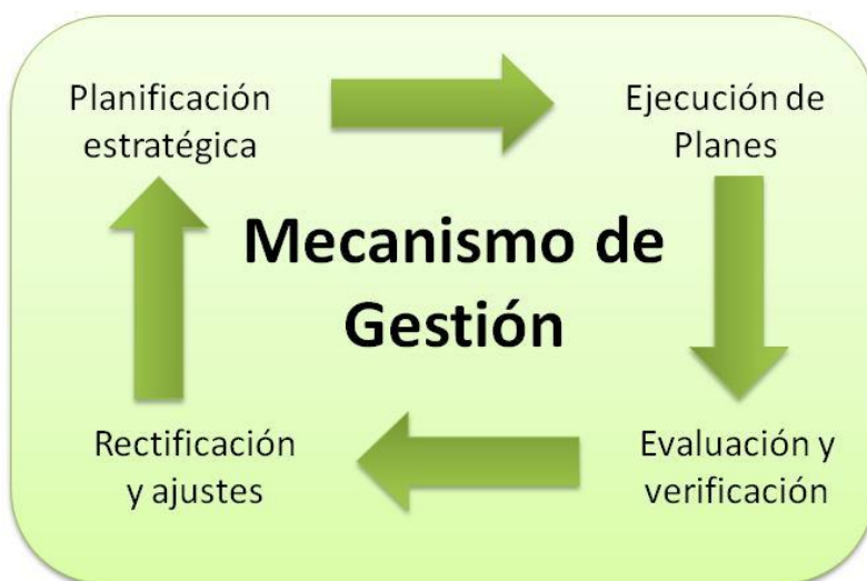
Figura 3: Mecanismo de Gestión

El proceso de gestión que se sugiere usar para la implementación de este plan es un modelo basado en el “Círculo de Deming” (de Edward Deming). Este modelo funciona a través de cuatro etapas o procesos sucesivos y cíclicos: planificación estratégica; ejecución de actividades; evaluación y verificación; y, rectificación y ajustes.