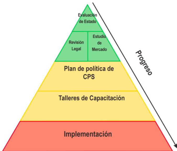
Figura 1: Metodología de implementación

El plan ha partido de lo desarrollado en las etapas anteriores y pretende aunar todos los esfuerzos del Estado que tengan la intención de incorporar las compras sustentables a sus procesos de contratación durante el periodo 2012-2016. En la actualidad ya existen esfuerzos aislados de algunas instituciones que han iniciado la incorporación de criterios ambientales a sus contrataciones pero de una forma aislada y con bajos niveles de monitoreo y seguimiento.